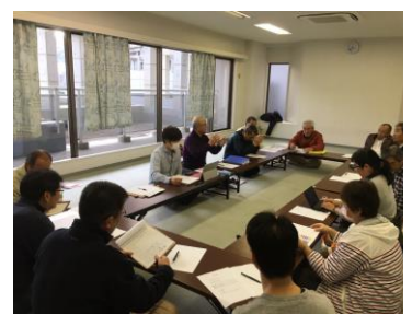
役員会は「防災」・「福祉」 A. CITY自治会