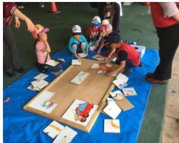
パズルゲーム 呉昭和自主防災会連合会